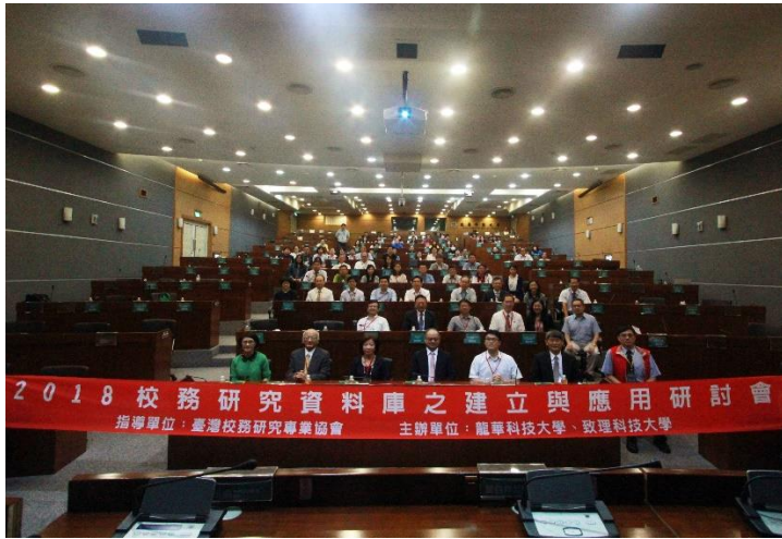
>>9/28 2018 校務研究資料庫之建立與應用