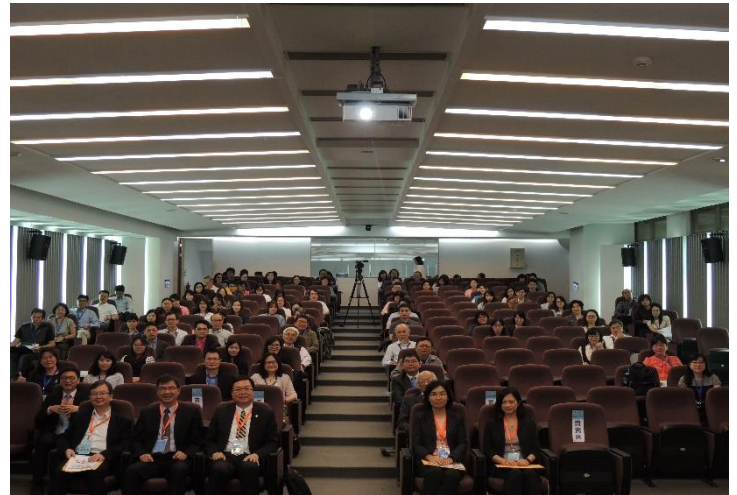
>>2018 校務研究高教深耕學術研討會。