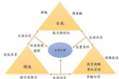
圖 2 生涯金三角理論模型。

近幾年來我國大專院校致力於推動校務研究(Institutional Research; IR)的發展，從設立研究辦公室、資料庫建置、大數據分析等，來強化學校經營的績效、確保教學與學習品質、環境變遷的因應，結合不同專業領域來提升學校未來發展。而我國學校針對學生踏入職場生涯所因應產業趨勢發展的變化，而規劃出吸引學生的幾個面向： (1) 設計學生學習地圖(人才發展規劃) (2) 校與校之間的聯盟 (3) 將學習的內容貼近國際交流(如，姊妹校的交換、短期研習營等) (4) 同時增加產業鏈結機會(如，實習或參訪等) 然而，先進國家則是對學生進行滿意度調查，瞭解學生在選擇學校時有哪些面向會影響學生的選擇，以下幾點是歸類出影響學生選擇的重要因素 (1) 學校在學術界的聲譽 (2) 學生訴求偏好 (3) 往後就業規劃 (4) 獎助金的補助 (5) 生活成本 (開銷)。藉此深入瞭解學生的選擇需求，將其納入招生策略中，這也是提升註冊率的戰略，如同 Swain(1984)所提出的生涯金三角理論，分成「自我」、「環境」及「教育與職業的資訊」，而这三項因素分別相互影響著學生在選擇生涯規劃的重要面向。