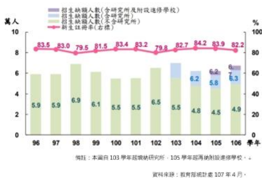
圖 1 近年大專校院招生缺額人數及新生註冊率。

近幾年來我國大專院校致力於推動校務研究(Institutional Research; IR)的發展，從設立研究辦公室、資料庫建置、大數據分析等，來強化學校經營的績效、確保教學與學習品質、環境變遷的因應，結合不同專業領域來提升學校未來發展。而我國學校針對學生踏入職場生涯所因應產業趨勢發展的變化，而規劃出吸引學生的幾個面向： (1) 設計學生學習地圖(人才發展規劃) (2) 校與校之間的聯盟 (3) 將學習的內容貼近國際交流(如，姊妹校的交換、短期研習營等) (4) 同時增加產業鏈結機會(如，實習或參訪等) 然而，先進國家則是對學生進行滿意度調查，瞭解學生在選擇學校時有哪些面向會影響學生的選擇，以下幾點是歸類出影響學生選擇的重要因素 (1) 學校在學術界的聲譽 (2) 學生訴求偏好 (3) 往後就業規劃 (4) 獎助金的補助 (5) 生活成本 (開銷)。藉此深入瞭解學生的選擇需求，將其納入招生策略中，這也是提升註冊率的戰略，如同 Swain(1984)所提出的生涯金三角理論，分成「自我」、「環境」及「教育與職業的資訊」，而这三項因素分別相互影響著學生在選擇生涯規劃的重要面向。